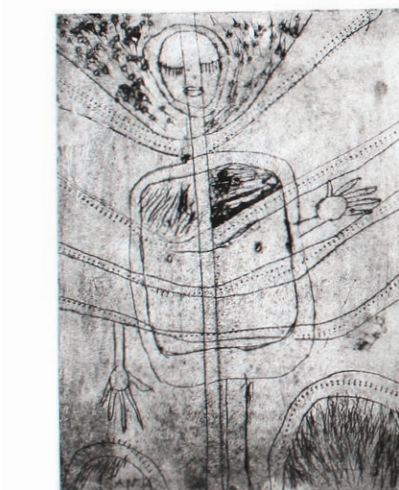
SLIKA 1: TISK S ŠTAMPILJKO.