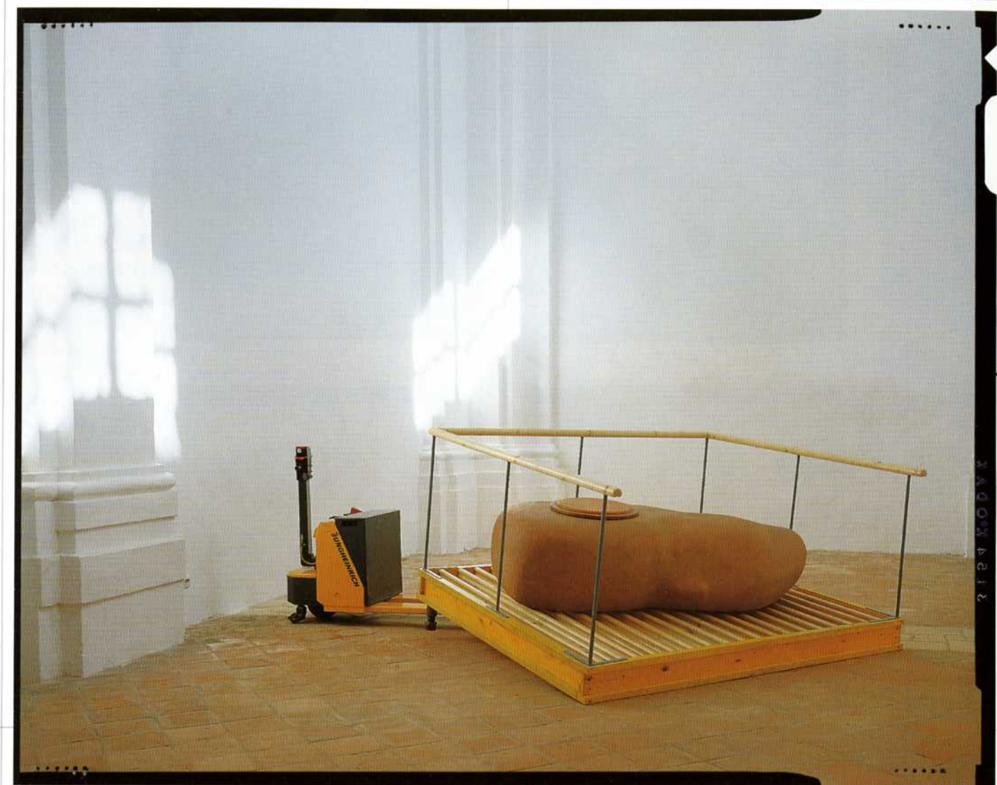
Premik glave – 1998 lendapor, les, viličar Jungheinrich