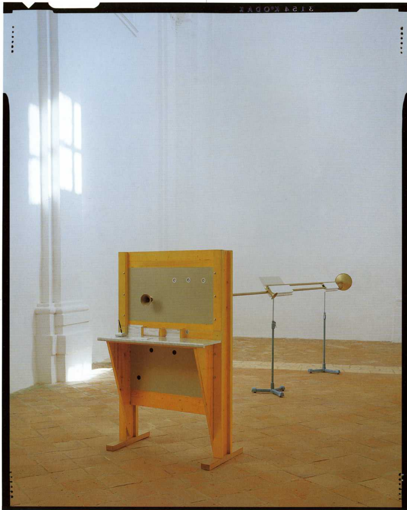
Banka – 1997 les, medenina, položnice, kemični svinčnik