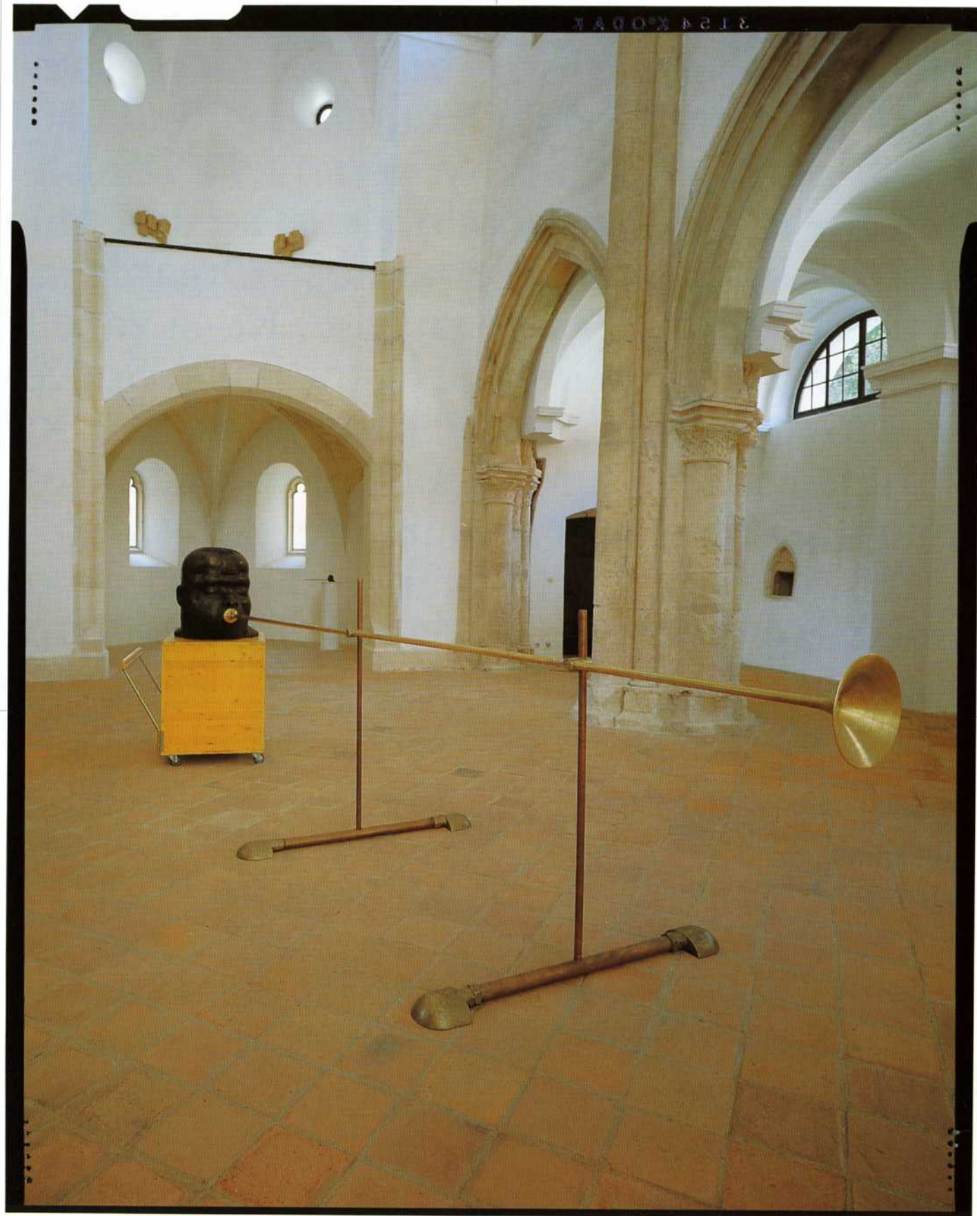
F. B. Trobilec – 1997 bron, medenina, baker, les last: Factor Banka