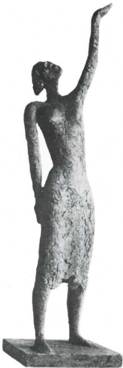
Krik žene, 1968